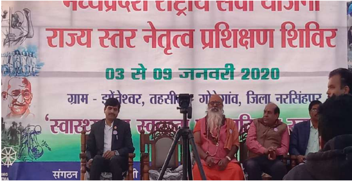
राज्यस्तरीय नेतृत्व प्रशिक्षण शिविर के बौद्धिक सत्र का दृश्य