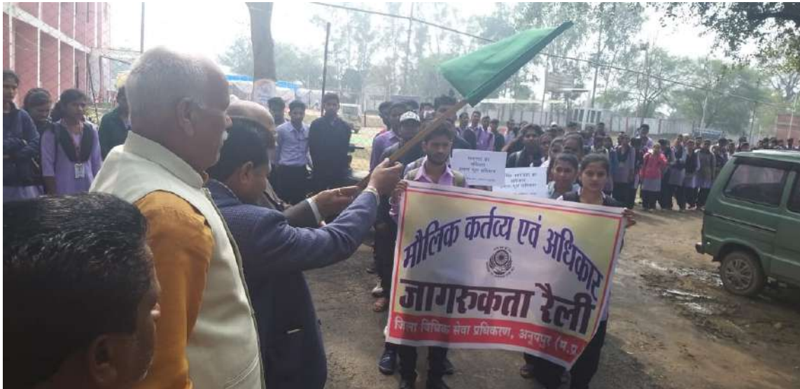
रैली को हरी झंडी दिखाकर रवाना करते माननीय न्यायधीश महोदय