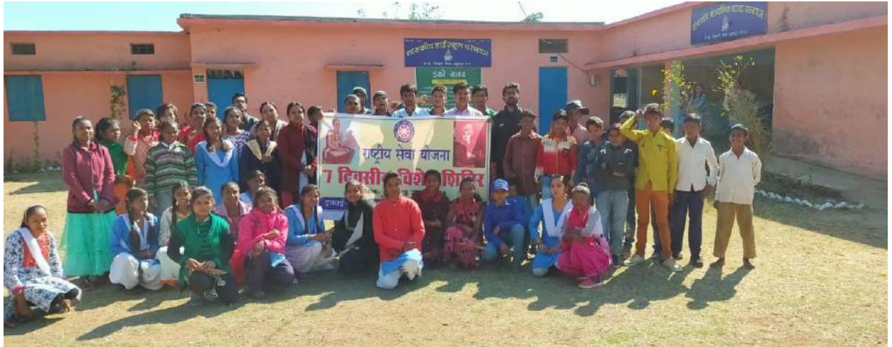
शासकीय विद्यालय के बच्चों को स्वच्छता का पाठ पढ़ाते शिविरार्थी