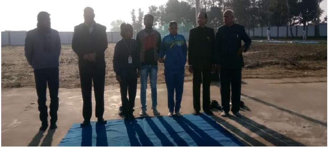
युवा दिवस के अवसर पर सूर्य नमस्कार के पूर्व प्राचार्य महोदय के साथ अन्य प्राध्यापकगण