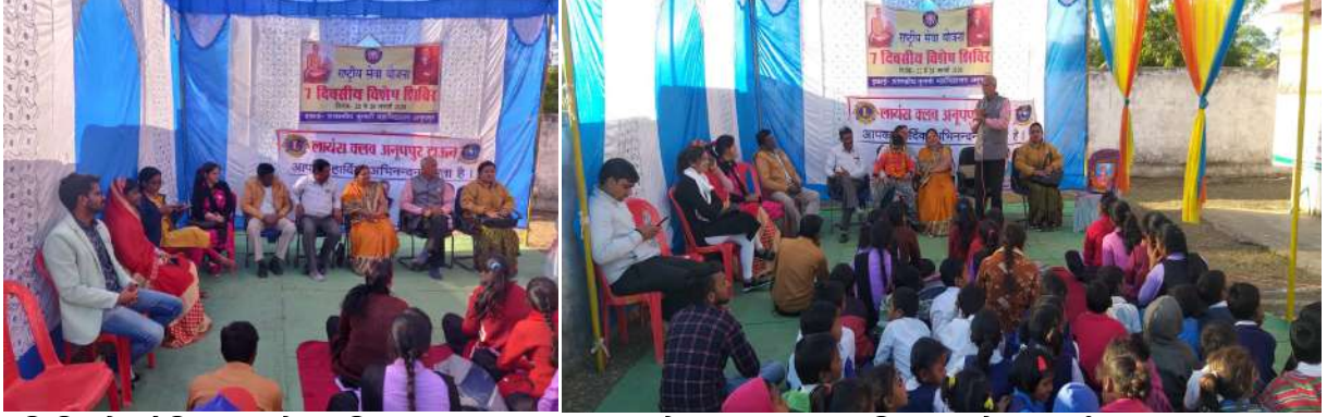
शिविर के बौद्धिक सत्र में उपस्थित लायंस क्लब अनूपपुर के सदस्य एवं महाविद्यालय के प्राचार्य एवं प्राध्यापकाण