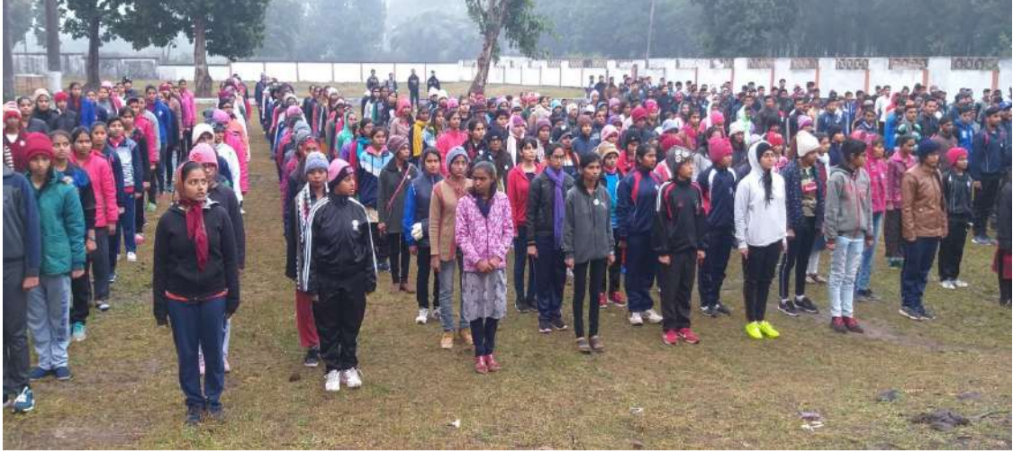
राज्यस्तरीय शिविर के प्रथम सत्र का दृश्य