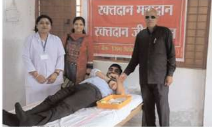
गुड मॉर्निंग, अनूपपुर

शासकीय तुलसी महाविद्यालय में राष्ट्रीय सेवा योजना इकाई तत्वावधान में दिनांक