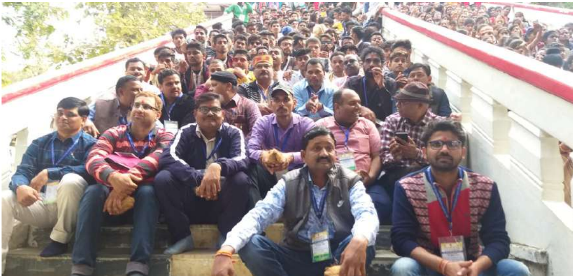
शिविरार्थियों की ग्रुप फोटो