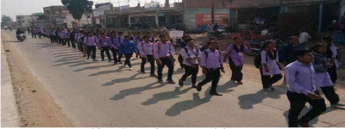
मौलिक कर्तव्य एवं अधिकार जागरूकता रैली का दृश्य